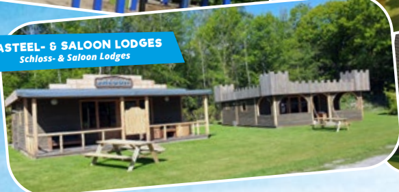
KASTEEL- & SALOON LODGES Schloss- & Saloon Lodges